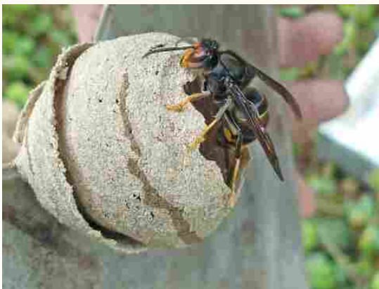
Nid primaire souvent à hauteur d'homme

La période hivernale ne tue pas forcément les fondatrices qui partent du nid